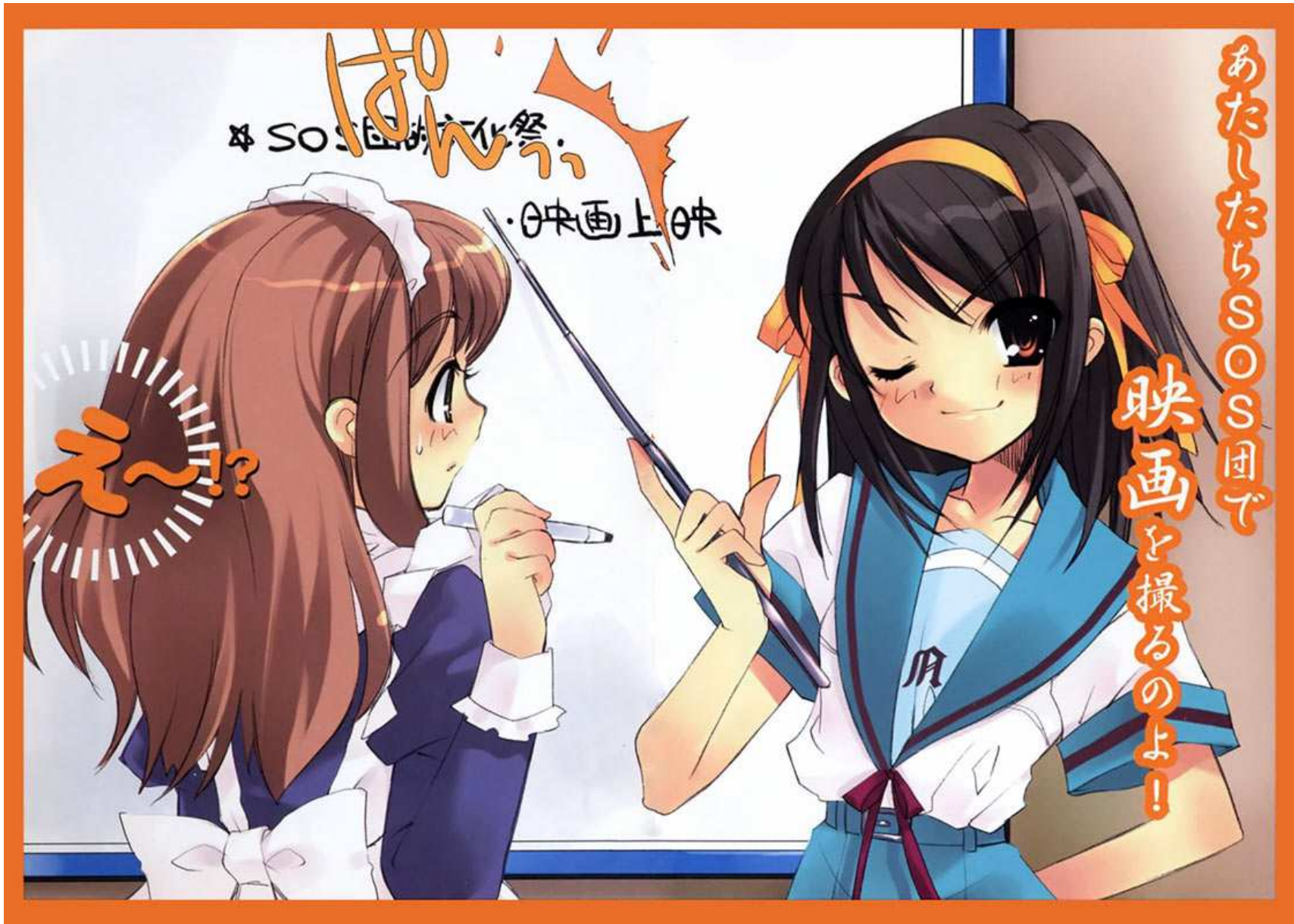
"¡La Brigada SOS va a hacer una película!"